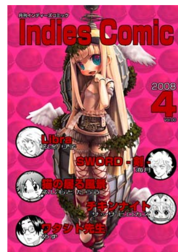
<月刊インディーズコミック表紙画像>

「今回の取り組みにあたって、最も重要と考えたのは、著作権者権利保護の仕組みでした。FLASHでのマンガビューワーは、パラパラと画像をめくる感覚をアニメーション風に演出したり、高画質なJpegファイルを手軽に利用できるなどのメリットがある反面、JpegファイルがWebブラウザのキャッシュに残るため、違法コピーや二次利用を防げないというデメリットがありました。ファンタジスタは、『同人マンガ家の育成・そのための環境整備』を企業コンセプトとしており、立場の弱い同人マンガ家の権利保護をしながら、作品を流通させることができる仕組みを探していました。」